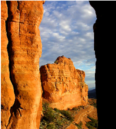
カセドラルロック