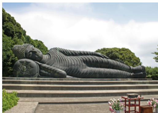
常楽山萬徳寺(釈迦涅槃仏)